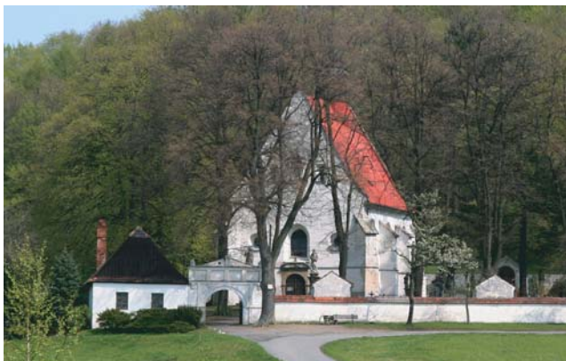
Jungfrau Maria Geburt Kirche