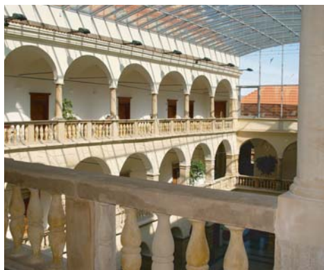
Arkaden des Schlosses