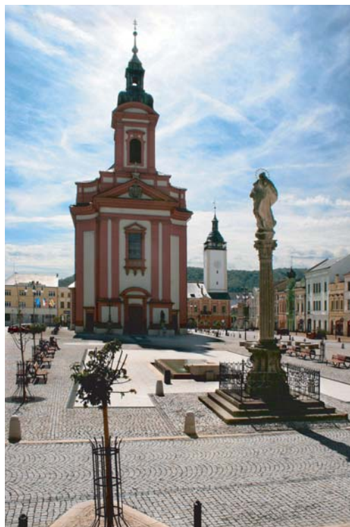
Jan der Täufer Enthauptung Pfarrkirche